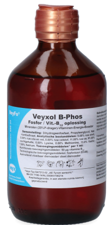
Frasco de 100ml con tapa de goma perforable.